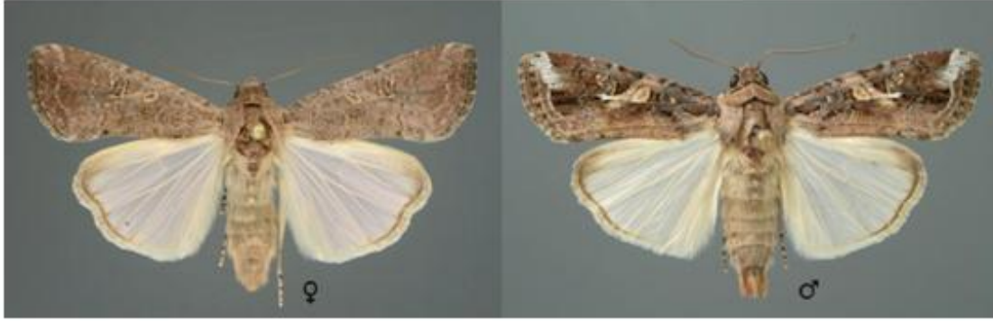
Εικόνα 5: Ενήλικο θηλυκό (αριστερά) και αρσενικό (δεξιά) του S. frugiperda .

Το Spodoptera frugiperda ολοκληρώνει το βιολογικό του κύκλο σε περίπου 30 ημέρες εάν οι συνθήκες είναι ευνοϊκές (ημερήσια θερμοκρασία 28°C), ειδικά κατά τους ζεστούς καλοκαιρινούς μήνες, αλλά αυτός ο κύκλος μπορεί να παραταθεί σε 60-90 ημέρες εάν οι θερμοκρασίες είναι ψυχρότερες.