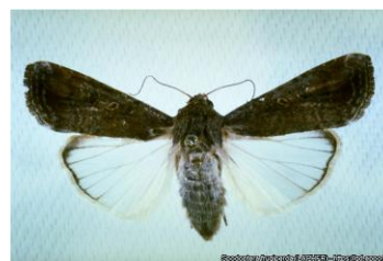
Adult female