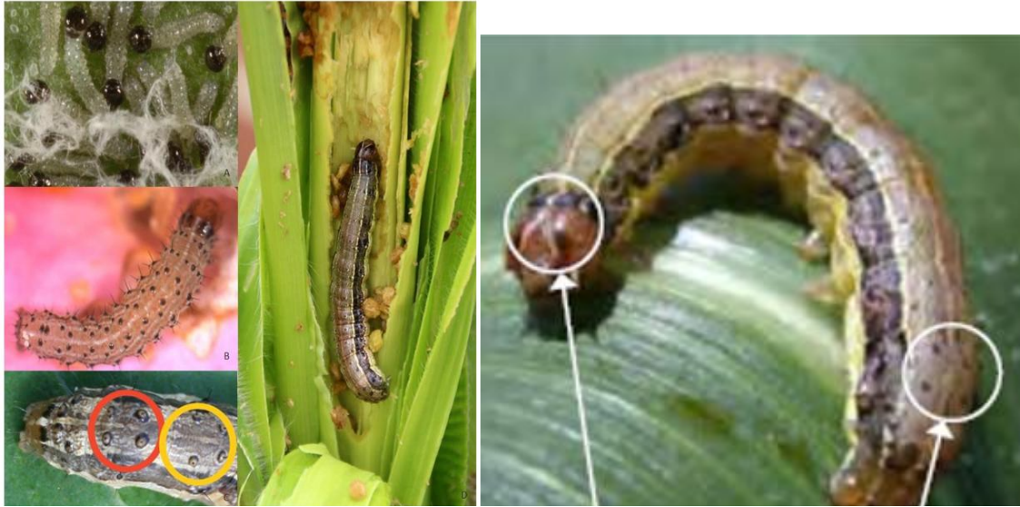
Εικόνα 3: Προνύμφες του S. frugiperda .

Μόλις η προνύμφη ολοκληρώσει την ανάπτυξή της πέφτει στο έδαφος όπου σε βάθος 2-8 cm σχηματίζει νυμφικό κελί από χώμα και μετάξινα νήματα εντός του οποίου μετατρέπεται σε νύμφη. Οι νύμφες έχουν λαμπερό καφέ χρωματισμό με μήκος που κυμαίνεται από 13-17 mm (Εικόνα 4).