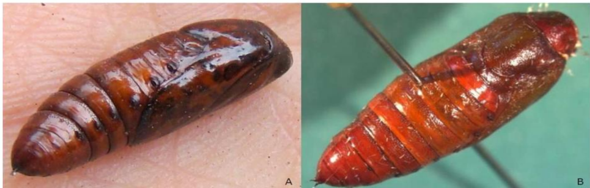
Εικόνα 4: Νύμφες του S. frugiperda .

Μόλις η προνύμφη ολοκληρώσει την ανάπτυξή της πέφτει στο έδαφος όπου σε βάθος 2-8 cm σχηματίζει νυμφικό κελί από χώμα και μετάξινα νήματα εντός του οποίου μετατρέπεται σε νύμφη. Οι νύμφες έχουν λαμπερό καφέ χρωματισμό με μήκος που κυμαίνεται από 13-17 mm (Εικόνα 4).