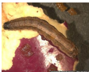
Larva on aubergine Marja van der Straten, Dutch NPPO