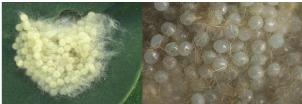
Εικόνα 2: Αυγά του S. frugiperda .

Η ωοτοκία του εντόμου λαμβάνει χώρα κατά τη διάρκεια της νύχτας. Το θηλυκό έντομο εναποθέτει τα αυγά του σε ομάδες των 150 έως 200 στα κατώτερα φύλλα των φυτών ξενιστών. Κάθε θηλυκό μπορεί να εναποθέσει περισσότερα από 1000 αυγά. Πολλές φορές τα αυγά εναποτίθενται σε δύο έως τέσσερα στρώματα και οι ωοπλάκες καλύπτονται από ένα στρώμα κίτρινου έως ροζ χρώματος προστατευτικού υλικού που παράγουν τα θηλυκά έντομα. Τα αυγά είναι σφαιρικά (0,75 mm διάμετρος) πράσινου χρωματισμού κατά την ωοτοκία που μετατρέπεται σε ανοικτό καφέ λίγο πριν την εκκόλαψη των προνυμφών. Ο χρόνος επώασης διαρκεί 2-3 ημέρες στους 20-30°C (Εικόνα 2).