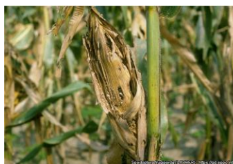
Damaged maize ear B.R. Wiseman - USDA/ARS, Tifton (US)