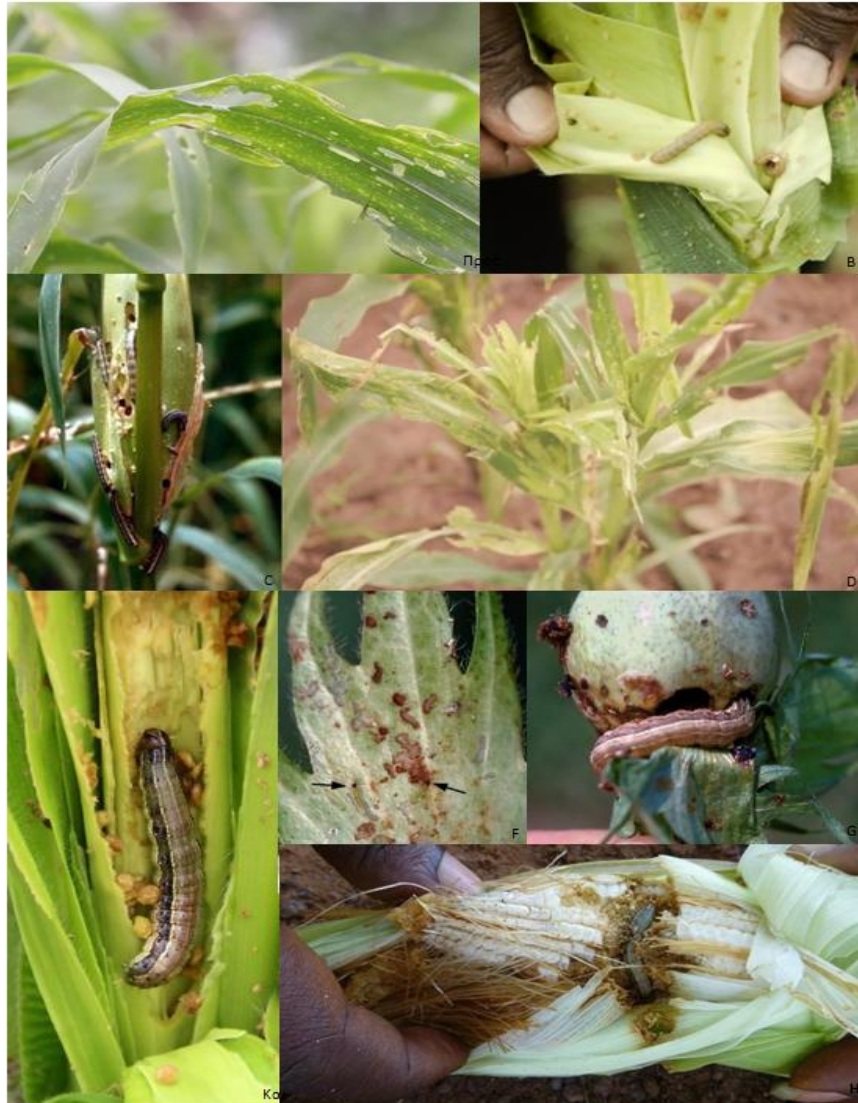
Εικόνα 7. Συμπτώματα του S. frugiperda . Α, Βλάβη των προνυμφών σε φύλλα καλαμποκιού. Β Βλάβη των προνυμφών σε φυτό αραβοσίτου. C, Βλάβη των προνυμφών στο καλαμπόκι. D, Βλάβη των προνυμφών σε φύλλα καλαμποκιού. E, Ζημιές και περιττώματα προνυμφών σε φυτό καλαμποκιού. F, Βλάβη των προνυμφών στα φύλλα βαμβακιού. G, Βλάβη των προνυμφών σε καρύδια βαμβακιού. Η, Βλάβη των προνυμφών σε σπάδικες καλαμποκιού.